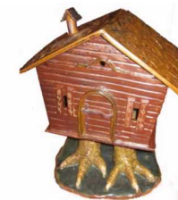
La cabane de Baba Yaga