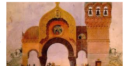
La grande porte de Kiev